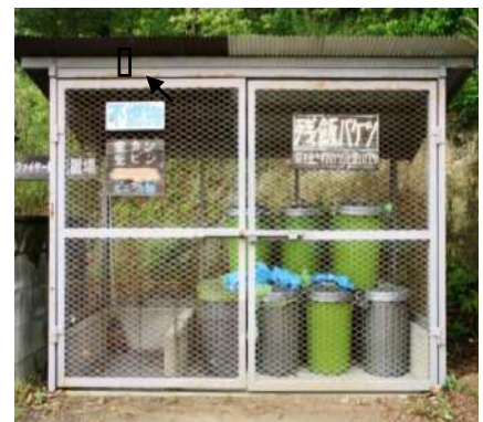
一般ゴミ・ペット