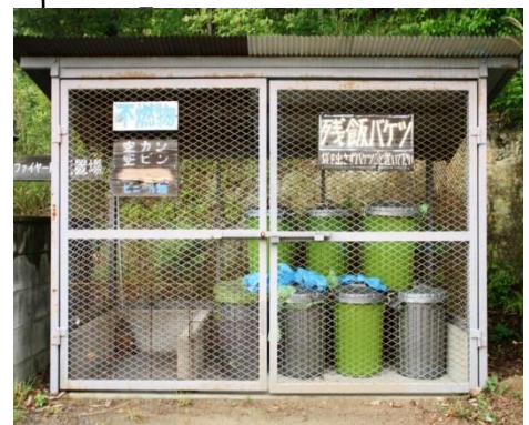
一般ゴミ・ペット