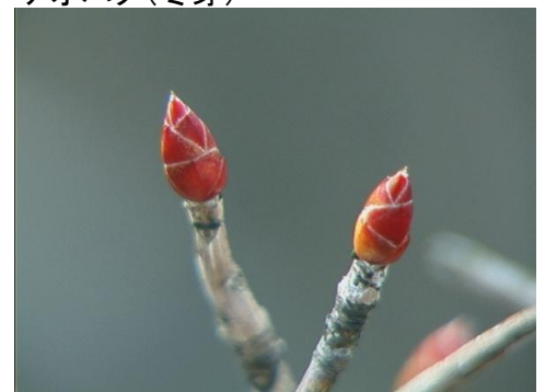
ドウダンツツジ(冬芽)